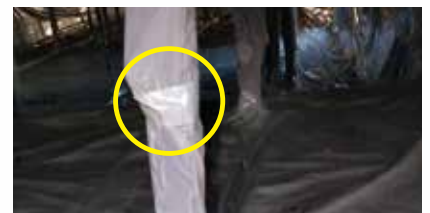
柱・ポールの養生に