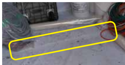
資材置き場の養生に